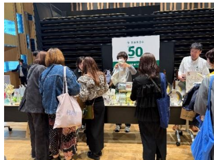
各メーカーブース、ハンズのプライベートブランドブースの賑わい