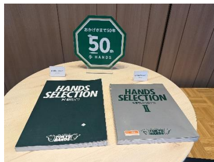
2026年8月に迎える創業50周年記念ブース